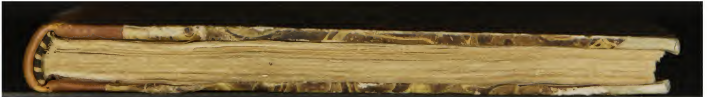
Magl. M.7.28 (a)